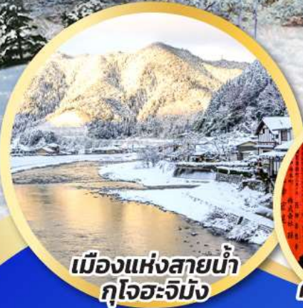
เมืองแห่งสายน้ำ กุโจอะจิมัง