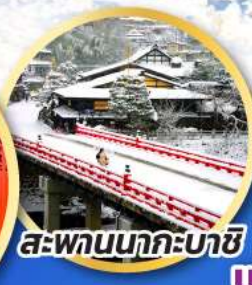
สะพานนากะบาชิ

ชมเมืองแห่งสายน้ำ บรรยากาศย้อนยุค "กุโจอะจิมัง"