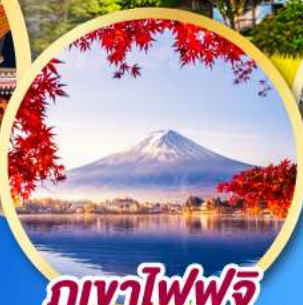
ภูเขาไฟฟูจิ