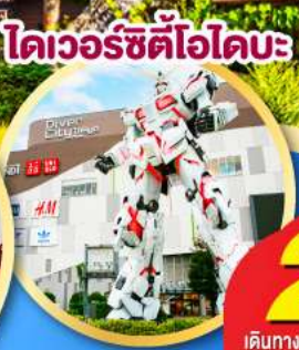
โดเวอร์ซิตีโอโดมะ