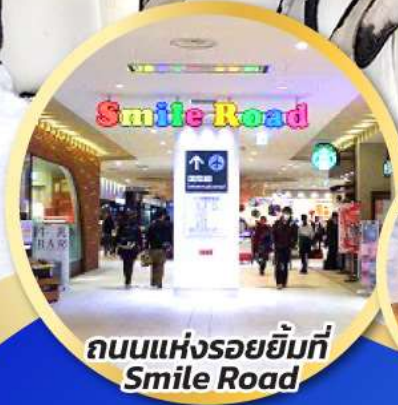
ถนนแห่งรอยยิ้มที่ Smile Road