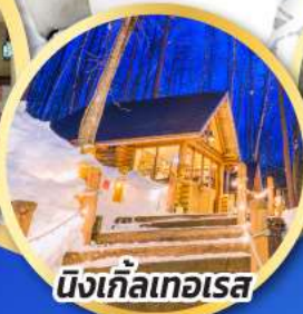
นิงเกิ้ลเทอเรส