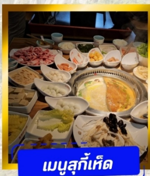
เมนูสุกั้เกิด