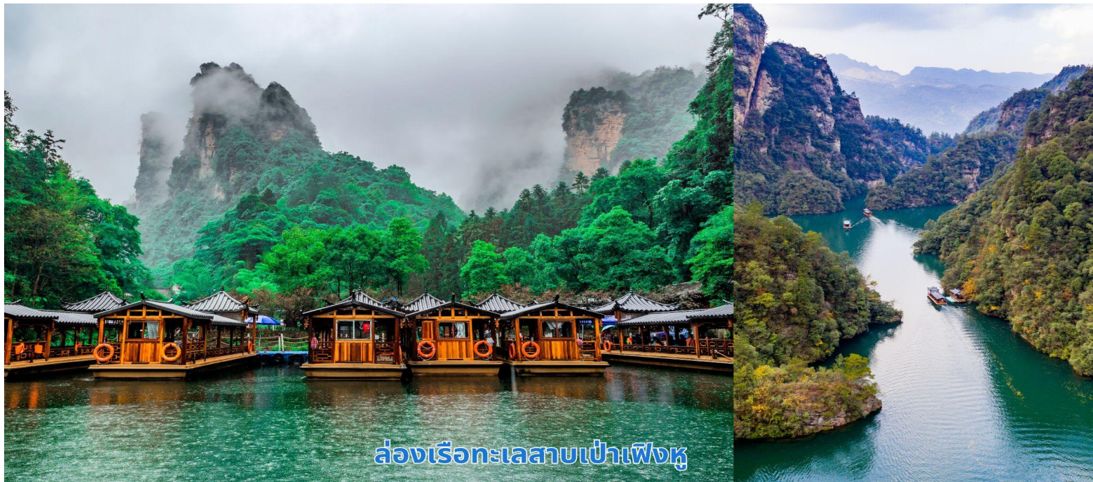
ล่องเรือทะเลสาบเป่าเฟิงหู

เช้า บริการอาหารเช้า ณ ห้องอาหารของโรงแรม นำท่านเพลิดเพลินไปกับการล่องเรือชมความงาม ทะเลสาบเป่าเฟิงหู (Baofeng Lake) ทะเลสาบที่สวยงามด้วยน้ำที่เป็นสีเขียวเข้มราวกับเนื้อหยกโอบล้อมด้วยภูเขาหินรูปทรงประหลาดแปลกตาต่าง ๆ มากมาย เป็นทะเลสาบบนที่สูง ที่หาชมได้ยาก ได้รับการขึ้นทะเบียนเป็นมรดกโลกทางธรรมชาติ ในปี ค.ศ. 1992