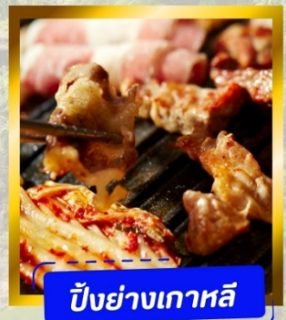
ปิ้งย่างเกาหลี