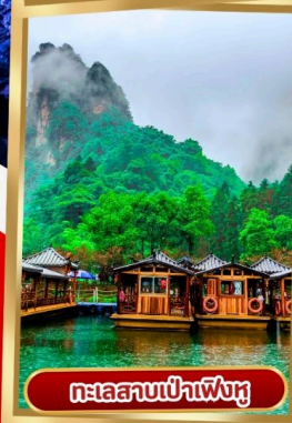
ทะเลสาบเป่าเฟิงหู