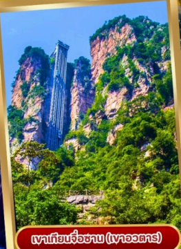
เขาเทียนจื่อซาน (เขาวงตาร)