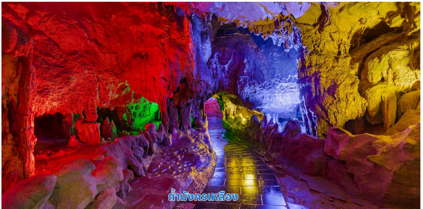
ถ้ำมังกรเหลือง