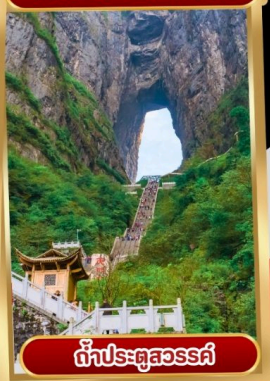
ถ้ำประตูสวรรค์