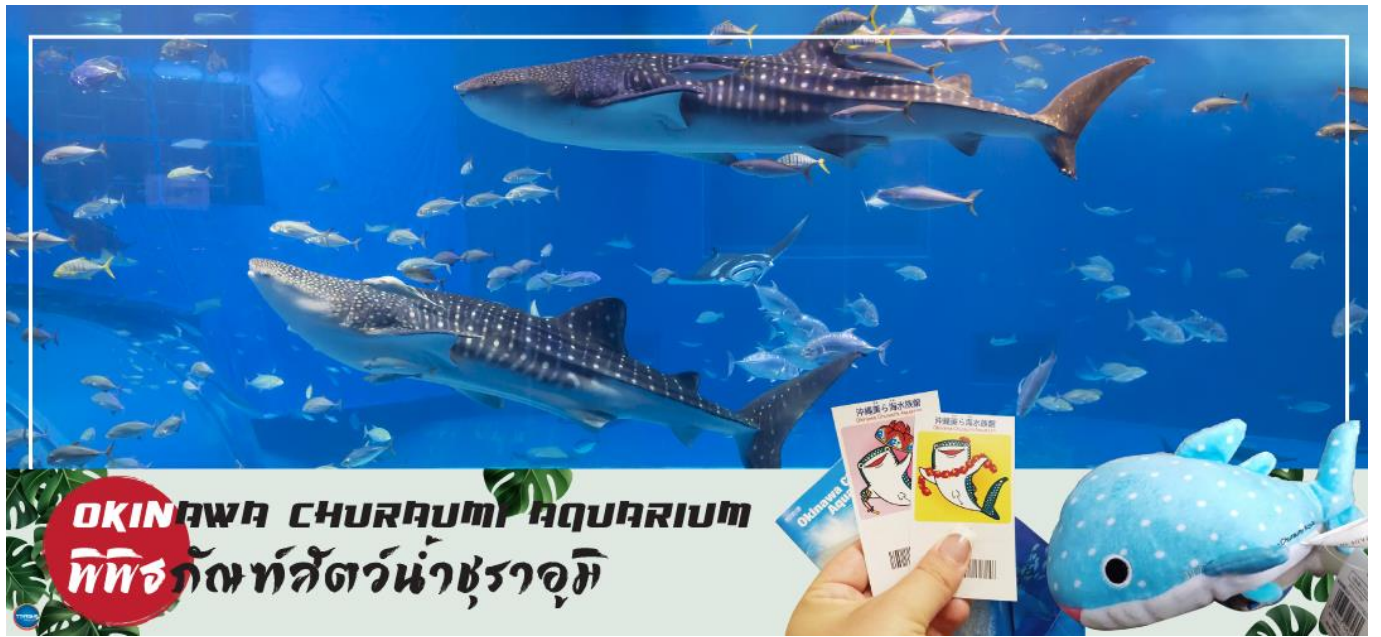
OKINAWA CHURAUMI AQUARIUM พิพิธภัณฑ์สัตว์น้ำชราอุมิ