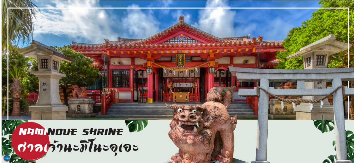
NAMINOUE SHRINE ศาลเจ้านะมิโนะอุเอะ

เช้า รับประทานอาหารเช้า ณ ห้องอาหารของโรงแรม (5) นำท่านเดินทางสู่ ศาลเจ้านะมิโนะอุเอะ (Naminoue Shrine) (ใช้เวลาเดินทางประมาณ 10 นาที) ตั้งอยู่ ณ บริเวณที่เป็นพื้นที่ศักดิ์สิทธิ์ที่ใช้ในการสวดภาวนาอธิษฐานต่อเทพเจ้าที่สถิตย์อยู่ ณ อาณาจักรเจ้าสมุทรโพ้นทะเลมาแต่ครั้งโบราณ ในอดีตชาวเรือที่เข้าออก ณ ท่าเรือนาสะ (Naha Port) ซึ่งขณะนั้นเป็นศูนย์กลางการแลกเปลี่ยนค้าขายกับนานาประเทศ ทั้งจีน ประเทศทางตอนใต้ เกาหลี และชวายามาโตะ มักจะแหงนหน้ามองขึ้นไปยังศาลเจ้าซึ่งตั้งอยู่บนหน้าผาสูงเพื่ออธิษฐาน และแสดงความขอบคุณ ศาลเจ้านะมิโนะอุเอะได้รับความเสียหายจากการรบในโอกินาวะ (Battle of Okinawa) เมื่อครั้งสงครามแปซิฟิก แต่ได้รับการบูรณะฟื้นฟูในเวลาต่อมาเมื่อสงครามสิ้นสุดลง ปัจจุบันนี้ได้กลายมาเป็นศูนย์กลางแห่งศาสนาชินโตในจังหวัดโอกินาวะ ชาวญี่ปุ่นมักจะมาไหว้ขอพรเกี่ยวกับธุรกิจการงานให้เจริญรุ่งเรือง ร่ำรวย และมาสะเดาะเคราะห์ให้พ้นโชคร้าย จากนั้นนำท่านสู่ เอาท์เลตมอลล์ อาชิบิโน่า (Okinawa Outlet Mall Ashibinaa) (ใช้เวลาเดินทางประมาณ 30 นาที) เอาท์เลตแห่งแรกในโอกินาวะ รวบรวมร้านค้าชั้นนำกว่า 100 ร้าน ทั้งเสื้อผ้าแฟชั่น สินค้าแบรนด์เนม นาฬิกา ข้าวของเครื่องใช้ ของเล่น ทุกร้านจัดเต็มทั้งสินค้านำเข้าและรุ่นใหม่ ลดราคากระหน่ำกว่า 30-80% ให้ได้เดินช้อปปิ้งท้ายทวีปกันอย่างจุใจ ภายใต้บรรยากาศสบายๆ สไตล์รีสอร์ทริมทะเล หากช้อปปิ้งเหนื่อยสามารถขึ้นไปทานอาหารที่ชั้น 2 มีอีกหลายร้านที่คอยให้บริการ