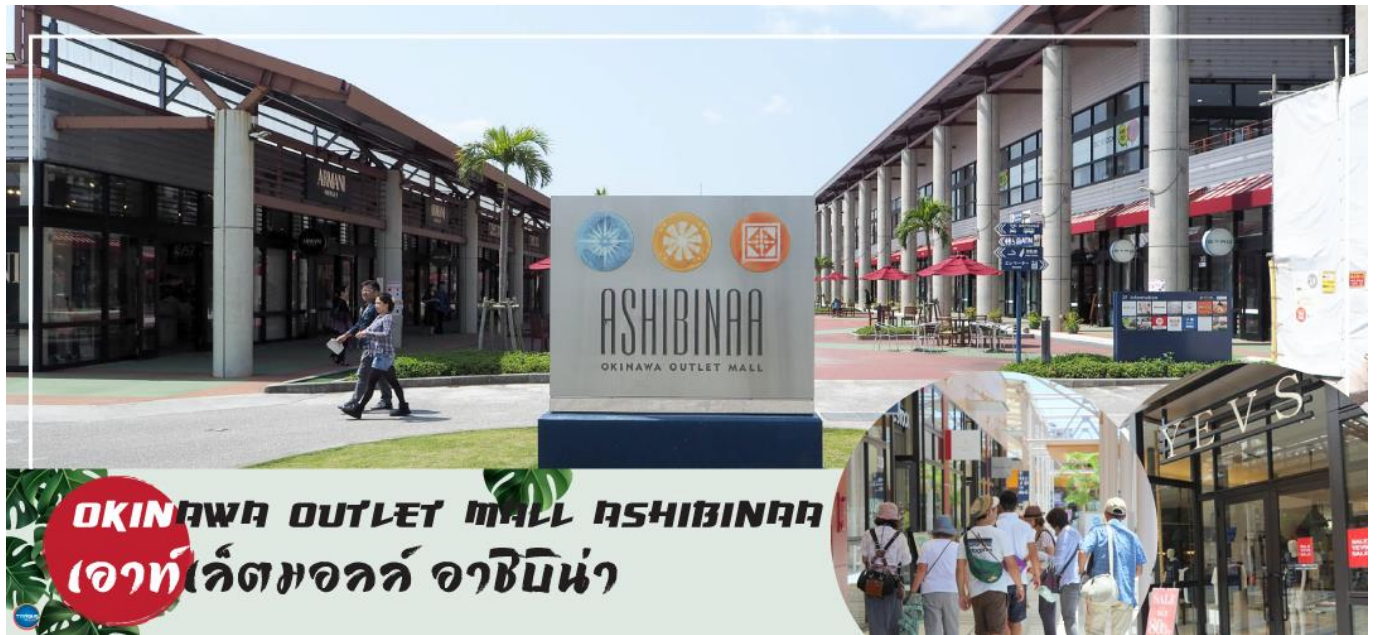
OKINAWA OUTLET MALL ASHIBINAA เอาท์เลตมอลล์ อาชิบิโน่า

เช้า รับประทานอาหารเช้า ณ ห้องอาหารของโรงแรม (5) นำท่านเดินทางสู่ ศาลเจ้านะมิโนะอุเอะ (Naminoue Shrine) (ใช้เวลาเดินทางประมาณ 10 นาที) ตั้งอยู่ ณ บริเวณที่เป็นพื้นที่ศักดิ์สิทธิ์ที่ใช้ในการสวดภาวนาอธิษฐานต่อเทพเจ้าที่สถิตย์อยู่ ณ อาณาจักรเจ้าสมุทรโพ้นทะเลมาแต่ครั้งโบราณ ในอดีตชาวเรือที่เข้าออก ณ ท่าเรือนาสะ (Naha Port) ซึ่งขณะนั้นเป็นศูนย์กลางการแลกเปลี่ยนค้าขายกับนานาประเทศ ทั้งจีน ประเทศทางตอนใต้ เกาหลี และชวายามาโตะ มักจะแหงนหน้ามองขึ้นไปยังศาลเจ้าซึ่งตั้งอยู่บนหน้าผาสูงเพื่ออธิษฐาน และแสดงความขอบคุณ ศาลเจ้านะมิโนะอุเอะได้รับความเสียหายจากการรบในโอกินาวะ (Battle of Okinawa) เมื่อครั้งสงครามแปซิฟิก แต่ได้รับการบูรณะฟื้นฟูในเวลาต่อมาเมื่อสงครามสิ้นสุดลง ปัจจุบันนี้ได้กลายมาเป็นศูนย์กลางแห่งศาสนาชินโตในจังหวัดโอกินาวะ ชาวญี่ปุ่นมักจะมาไหว้ขอพรเกี่ยวกับธุรกิจการงานให้เจริญรุ่งเรือง ร่ำรวย และมาสะเดาะเคราะห์ให้พ้นโชคร้าย จากนั้นนำท่านสู่ เอาท์เลตมอลล์ อาชิบิโน่า (Okinawa Outlet Mall Ashibinaa) (ใช้เวลาเดินทางประมาณ 30 นาที) เอาท์เลตแห่งแรกในโอกินาวะ รวบรวมร้านค้าชั้นนำกว่า 100 ร้าน ทั้งเสื้อผ้าแฟชั่น สินค้าแบรนด์เนม นาฬิกา ข้าวของเครื่องใช้ ของเล่น ทุกร้านจัดเต็มทั้งสินค้านำเข้าและรุ่นใหม่ ลดราคากระหน่ำกว่า 30-80% ให้ได้เดินช้อปปิ้งท้ายทวีปกันอย่างจุใจ ภายใต้บรรยากาศสบายๆ สไตล์รีสอร์ทริมทะเล หากช้อปปิ้งเหนื่อยสามารถขึ้นไปทานอาหารที่ชั้น 2 มีอีกหลายร้านที่คอยให้บริการ