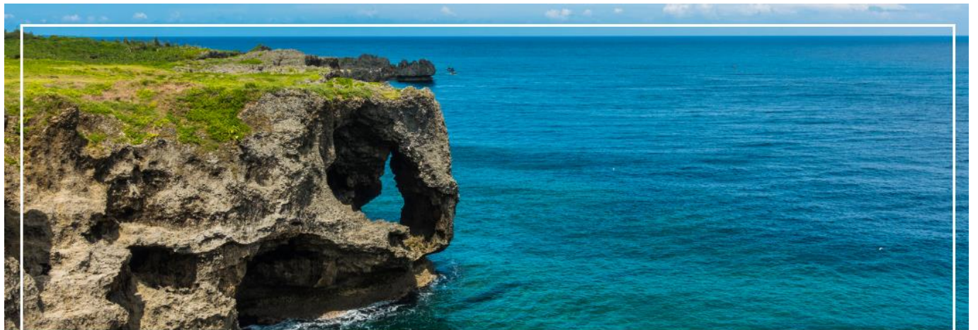
CAPE MANZAMO ผามันซาโมะ

จากนั้นนำท่านเดินทางสู่ ผามันซาโมะ (Cape Manzamo) (ใช้เวลาเดินทางประมาณ 1.20 ชั่วโมง) ผาหินที่สูงชันกว่า 30 เมตรมีลักษณะคล้ายวงช้างหันหน้าสู่ทะเลจีน พื้นที่สีเขียวของต้นหญ้าที่ขึ้นปกคลุมจนถึงยอดหน้าผาดัดกับผืนน้ำทะเลสีฟ้าใส เป็นทิวทัศน์ที่สวยงามที่สุดแห่งหนึ่งในโอกินาวา ในวันที่ท้องฟ้าสดใสจะสามารถ มองเห็นความสวยงามของเกาะทางตอนเหนือและเกาะที่อยู่นอกชายฝั่ง