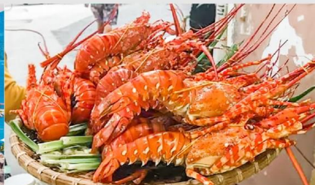
Nha Trang Night Market

*ทางบริษัทฯ ขอสงวนสิทธิ์ในการสลับโปรแกรมทัวร์ตามความเหมาะสมขึ้นอยู่กับสถานการณ์หน้างาน โดยคำนึงถึงผลประโยชน์ของลูกค้าเป็นสำคัญ