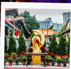
วัดหลวงต้าเซียน