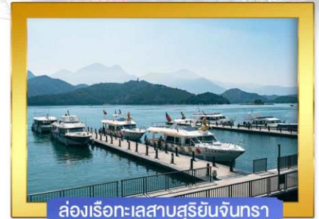
ล่องเรือทะเลสาบสุริยอันจันทร์