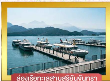
ล่องเรือทะเลสาบสุรียันจินตรา