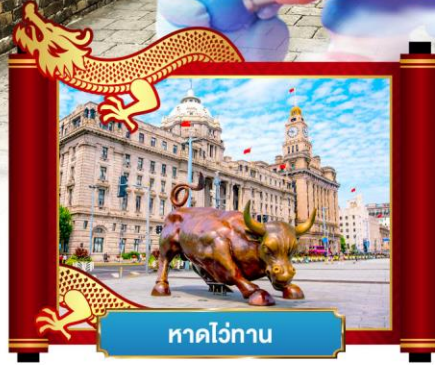
ทาดไว่ทาน