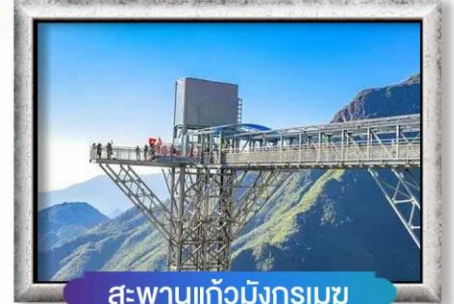
สะพานแก้วมิงกรเมซ