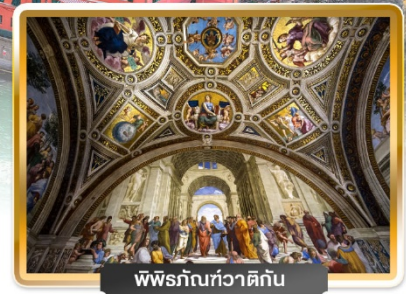
พิพิธภัณฑสถาน