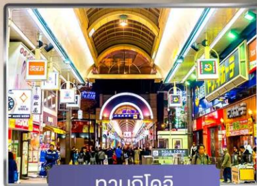
ทานุกิโคจิ