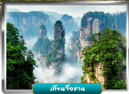
เทียนจื่อซาน