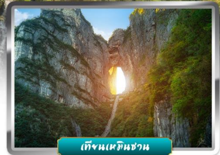
เทียนเหมินซาน