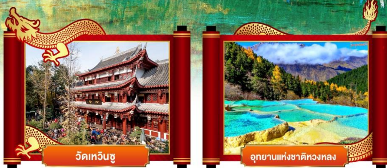
วัดเหวินซู