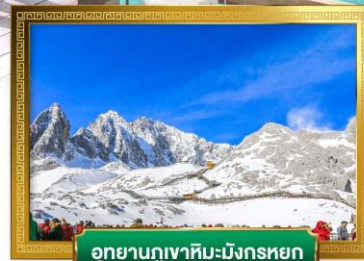
อุทยานภูเขาหิมะมังกรหยก