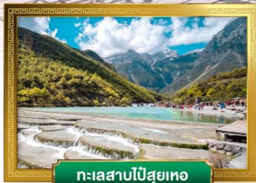
ทะเลสาบไป๋สฺยเหอ