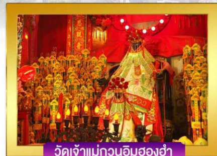
วัดเจ้าแม่กวนอิมสองฮ่า