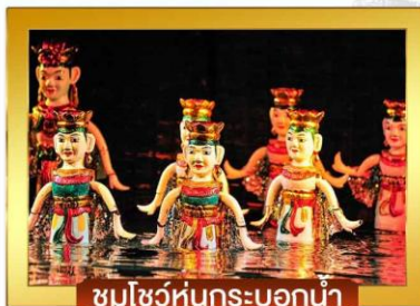
ชมโชว์หุ่นกระบอกน้ำ