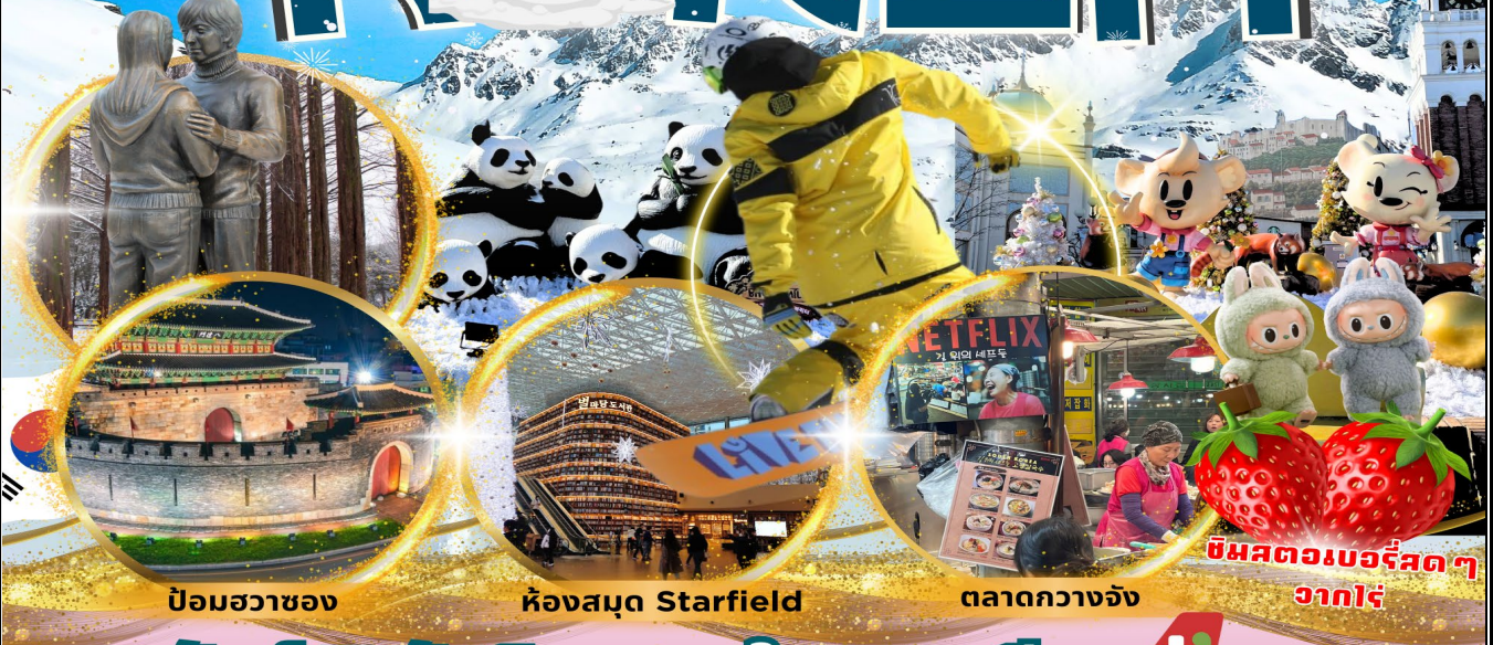
ป้อมฮวาซอง