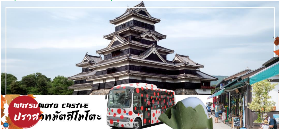
MATSUMOTO CASTLE ปราสาทมัตสึโมโตะ

จากนั้นนำท่านเดินทางสู่ คามิโคจิ (Kamikochi) (ใช้เวลาเดินทางประมาณ 50 นาที) แหล่งท่องเที่ยวทางธรรมชาติที่มีทิวทัศน์ภูเขาที่สวยงามที่สุดแห่งหนึ่งของประเทศญี่ปุ่น ดินแดนแห่งธรรมชาติท่ามกลางหุบเขาแสนสวยของเทือกเขา "เจแปน แอลป์" (Japan Alps) เป็นหุบเขาในฝันที่อยู่สูงขึ้นไปทางเหนือของเทือกเขาแอลป์ญี่ปุ่น ภาพสายน้ำของแม่น้ำอะซุสะ ที่ใสสะอาดไหลผ่านสะพานคัปปะ ล้อมรอบด้วยต้นป่าเขียวขจี และฉากหลังของยอดเขาสูงตระหง่านระดับ 3,000 เมตรให้ท่านได้เพลิดเพลินกับการเดินเล่นสบายๆ ไปกับธรรมชาติที่สวยงาม อิสระให้ท่านได้เก็บภาพความประทับใจตามอัธยาศัย สะพานคัปปะ-บะชิ เป็นจุดที่มีคนเยอะที่สุดในคะมิโคจิ และในบางครั้งก็ให้ความรู้สึกเหมือนทางแยกที่มีชื่อเสียงของชินญะ มีผู้คนมากมายเดินข้ามไปข้ามมาอยู่ไม่หยุดหย่อน มาถ่ายรูปใกล้กับสะพานหรือบนสะพาน นำท่านเดินทางสู่ เมืองมัตสึโมโตะ (Matsumoto) เป็นเมืองที่ใหญ่เป็นอันดับสองของจังหวัดนากาโนะ (ใช้เวลาเดินทางประมาณ 1 ชั่วโมง)