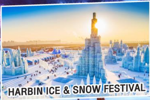
HARBIN ICE & SNOW FESTIVAL