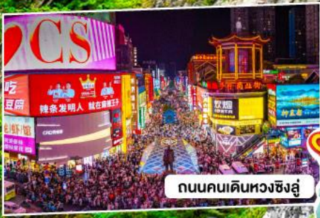
ถนนคนเดินหวงชิ่งอู่