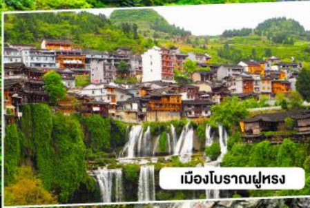
เมืองโบราณฝูหยง