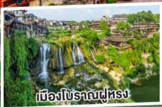
เมืองโบราณฟุหลง