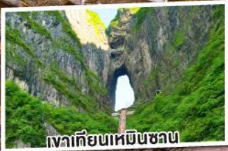
เงาเทียนเหมินชวน