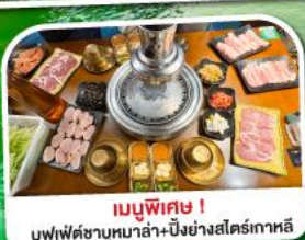
เมนูพิเศษ!