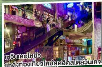
เทวินทอโฮ้อยู่