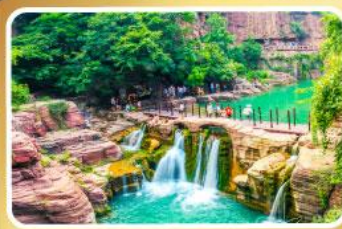
อุทยานหยุนโกซาน