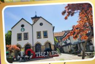
เทมส์ทาวน์