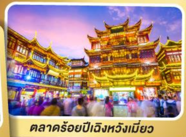
ตลาดร้อยปีเจิ้งหวงเมี่ยว

สนุกสุดมันส์ไปกับเครื่องเล่น Shanghai Disneyland เต็มวัน