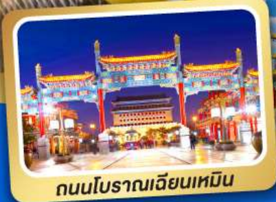
ถนนโบราณเฉียนเหมิน