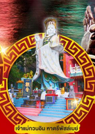
เจ้าแม่กวนอิม หาดริฟสส์เบย์