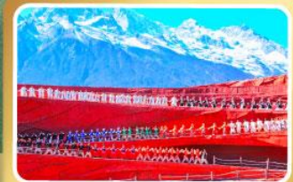
โชว์ Impression Lijiang