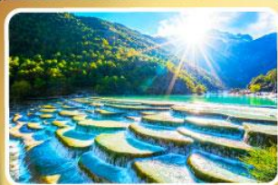
ภูเขาสีน้ำเงิน