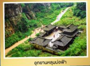
อุทยานหลุมบ่อฟ้า