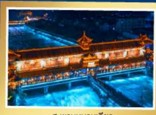
สะพานหนานเฉียว