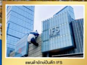
แพนต้าอิกซ์ป็นตัก IFS