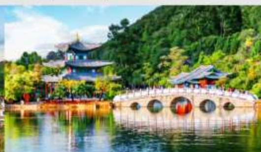
สระมังกรดำ