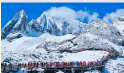
ภูเขาหิมะมังกรหยก