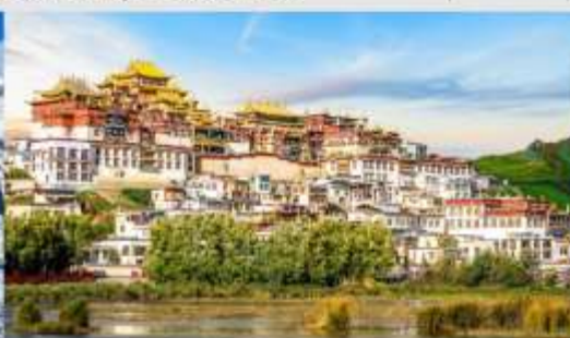
วัดลามะชงจ้านหลิน