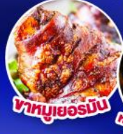
ขาหมูเยอรมัน