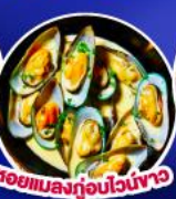
หอยแมลงภู่นิวไอร์แลนด์