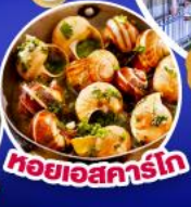
หอยแอสคาร์โท