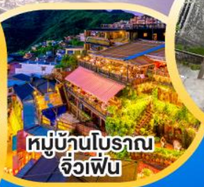
หมู่บ้านโบราณ จิวเฟิน