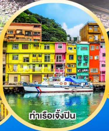
ท่าเรือเจิ้งปิ่น