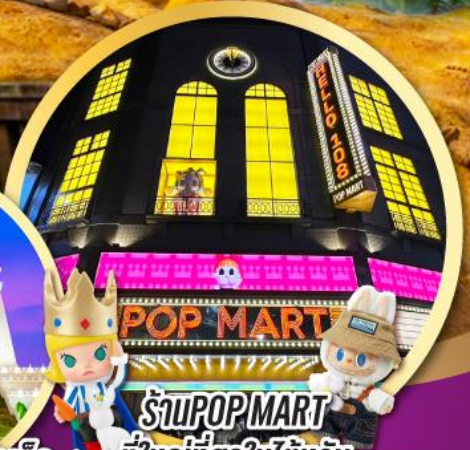
ร้าน POP MART ที่ใหญ่ที่สุดในไต้หวัน เริ่มต้น