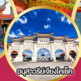
อนุสาวรีย์เจียงไคเช็ค