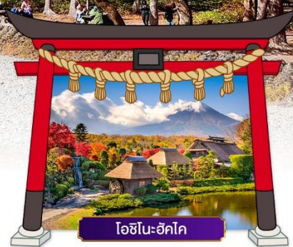
โอชิโนะฮักไก

เดินทางโดยสายการบิน : ไทยแอร์เอเชียเอ็กซ์