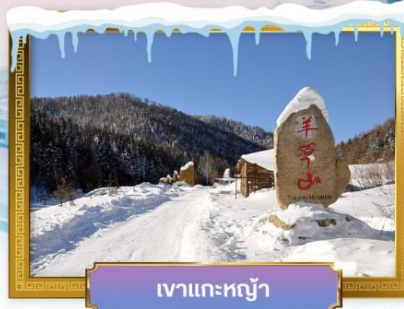
เขาแกะหยู๋