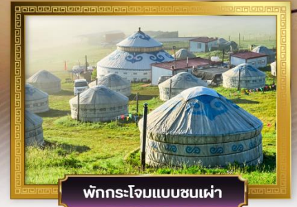
พักกระโจมแบบชนเผ่า

เดินทางโดย: สายการบินโซนาเซาเทิร์นแอร์ไลน์