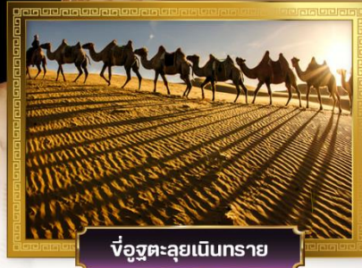
ขี่อูฐทะเลทรายเนินทราย