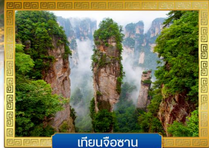
เทียนจื่อซาน