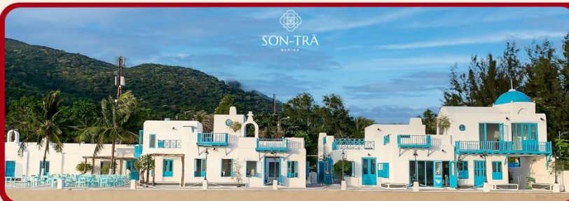
เช็คอินคาเฟ่ SON TRA MARINA