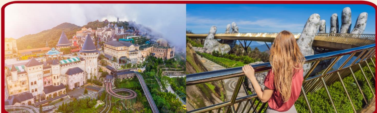
เที่ยวบานาฮิลล์เต็มวัน แบบจุใจ