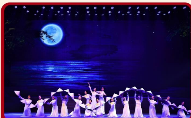
ชม CHARMING SHOW