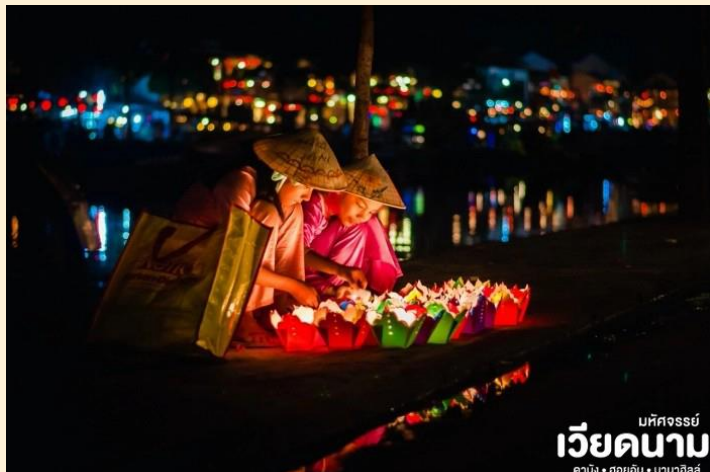
บหัทจรรย เวียดนาม คามิง • ฮอยอัน • นานาฮิลล์