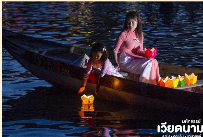
บหัทจรรย เวียดนาม คามิง • ฮอยอัน • นานาฮิลล์

ที่พัก เข้าสู่ที่พัก TTC HOI AN 4* หรือเทียบเท่ามาตรฐานเวียดนาม (โรงแรมที่ระบุในรายการทัวร์เป็นเพียงโรงแรมที่นำเสนอเบื้องต้นเท่านั้น ซึ่งอาจมีการเปลี่ยนแปลงแต่โรงแรมที่เข้าพักจะเป็นโรงแรมระดับเทียบเท่ากัน)