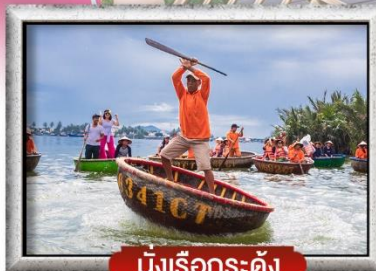
นั่งเรือกระด้าง