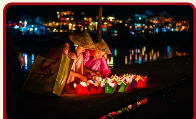
ล่องเรือลอยกระทงที่ฮอยอัน