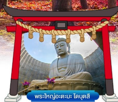
พระใหญ่อะตะมะ ไดบุตสึ