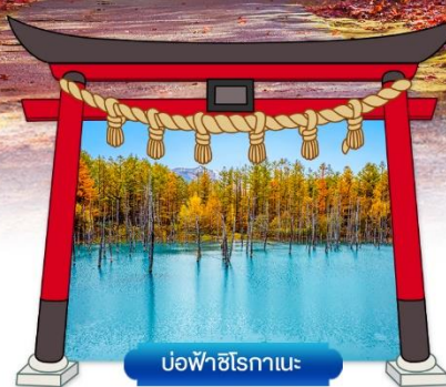
บ่อฟิชิโรทานะ