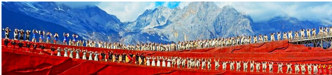
การแสดง IMPRESSION LIJIANG

นักแสดงกว่า 600 ชีวิต แสง สี เสียง การแต่งกายตระการตา เล่าเรื่องราวชีวิตความเป็นอยู่ และชาวเผ่าต่างๆ ของเมืองลี่เจียง