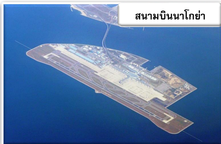
สนามบินนาโกย่า

บริการอาหารร้อนบนเครื่องพร้อมกับเมนูผลไม้สดเพื่อเติมเต็มความพิเศษไปพร้อมกับความสดชื่น