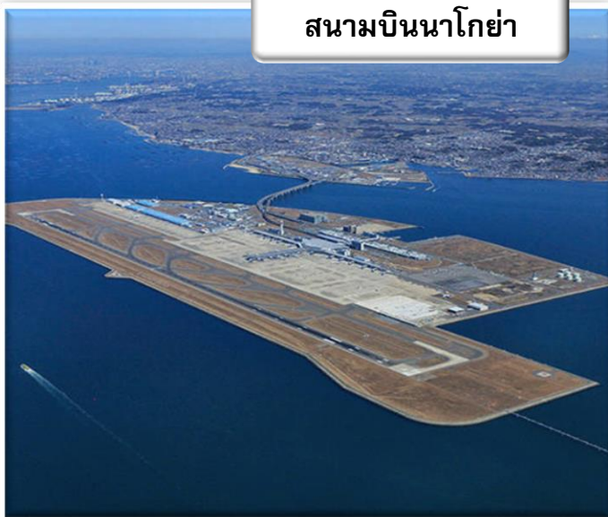
สนามบินนาโกย่า

เวลา 00.05 น. ออกเดินทางสู่ สนามบินนาโกย่า ประเทศญี่ปุ่น โดย สายการบินไทย เที่ยวบินที่ TG 644