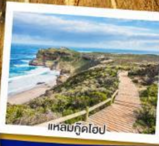
แหลมทูดโฮป