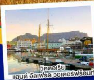
วิกตอเรีย แอนต์ อัลเฟรด วอเตอร์ฟร้อนท์