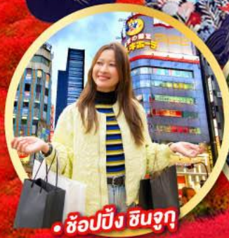
• ช้อปปิ้ง ชินจูกุ

กิจกรรมใส่ชุดกิโมโน พร้อมชมโชว์การแสดงต่างๆ