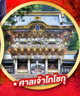
• ศาลเจ้าโทโฮกุ