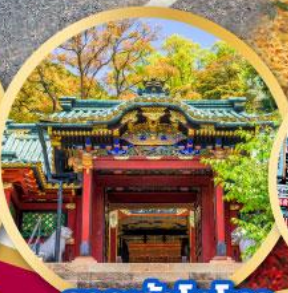
ศาลเจ้าโทโชคุ