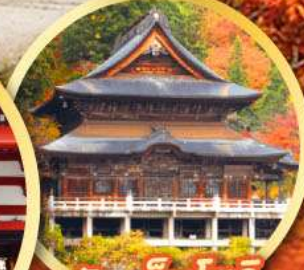
วัดเอ็นโซจิ

กิจกรรมเก็บผลไม้ พักออนเซ็น 2 คืน พักโรงแรมในโตเกียว 2 คืน