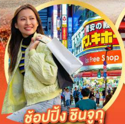
ช้อปปิ้ง ซินจูกุ