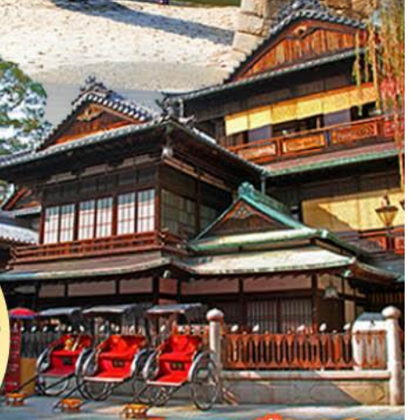
ออนเซ็น 300 ปี โดโงะออนเซ็น