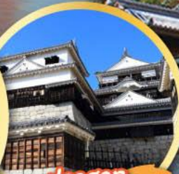
ปราสาทมัตสึยาม่า