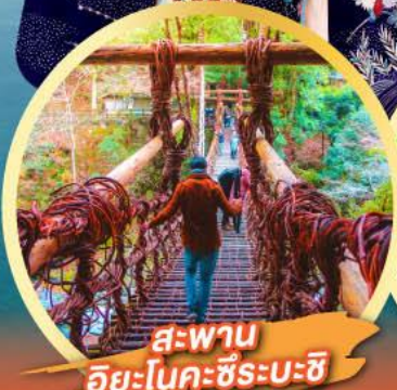
สะพานฮิยะโนคะชิระบะชิ