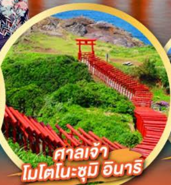
ศาลเจ้าโมโตโนะซุมิ อินาริ