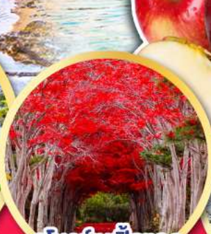
อุโมงค์เมเปิ้ลแดง ณ สวนลึบฮิราโอกะ