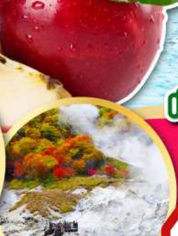
หุบเขานรกจิกอกุคานิ