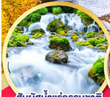
สัมผัสน้ำแร่ธรรมชาติ ณ สวนพุทิตาชิ